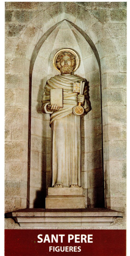
SANT PERE FIGUERES

Narcís Monturiol i Estarriol ( Figueres 28 de setembre de 1819 - Sant Martí de Provençals, Barcelona, 6 de setembre de 1885 ) va ser un enginyer , intel·lectual , impressor , editor , pintor , [2] polític i inventor català , cèlebre per la invenció del primer submarí tripulat i impulsat per una forma primerenca de propulsió autònoma amb un motor químic anaeròbic, anomenat Ictíneo .